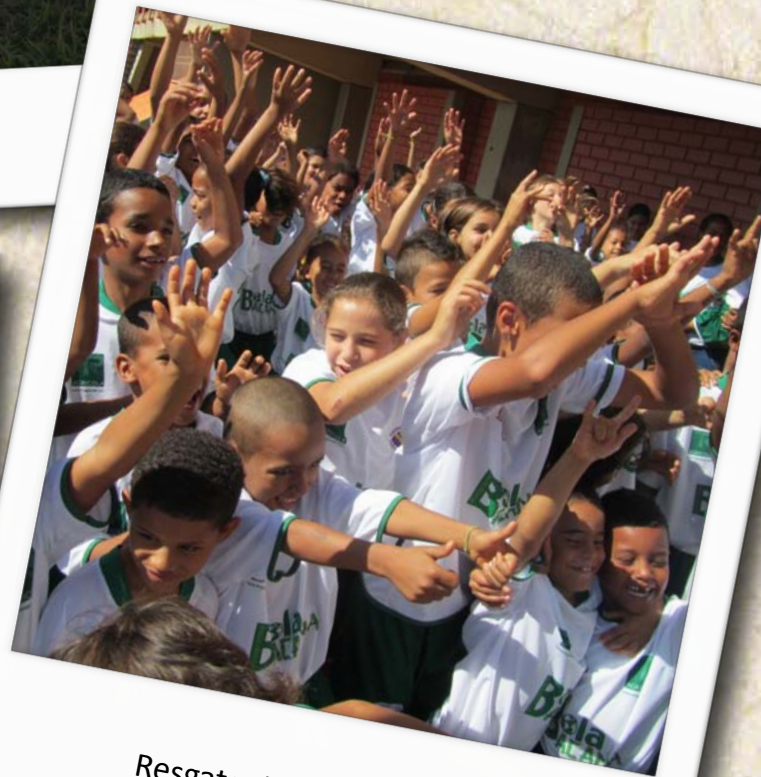
Resgate da auto-estima...