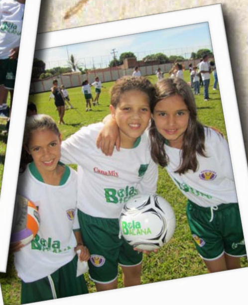
Respeito aos companheiros