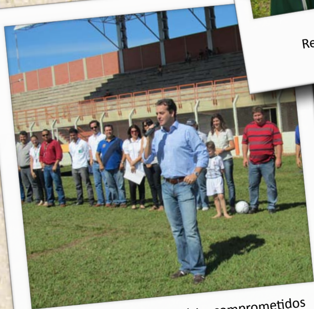
Uma geração de empresário, comprometidos não somente com o lucro, mas também com as questões sociais do país .