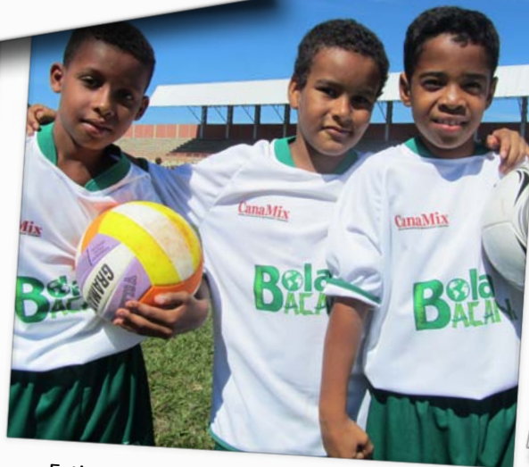
Estimular o desenvolvimento escolar de crianças pertencentes a classes sociais marcadas por desigualdades econômicas.