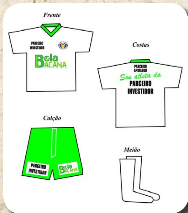
Aplicação da marca do PARCEIRO INVESTIDOR nos uniformes esportivos dos alunos