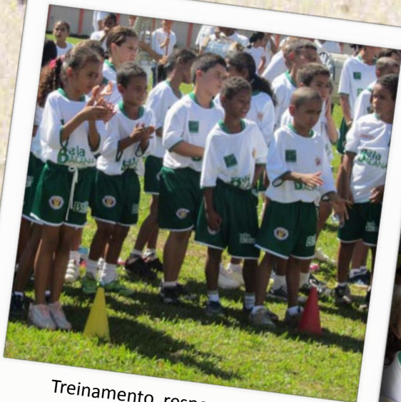
Treinamento, responsabilidade, dedicação, respeito, desenvolvimento, objetivo, amizade, realização...