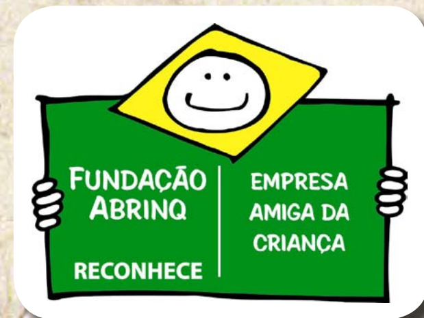
Reconhecimento como Empresa “Amiga da Criança” junto à Fundação ABRINQ