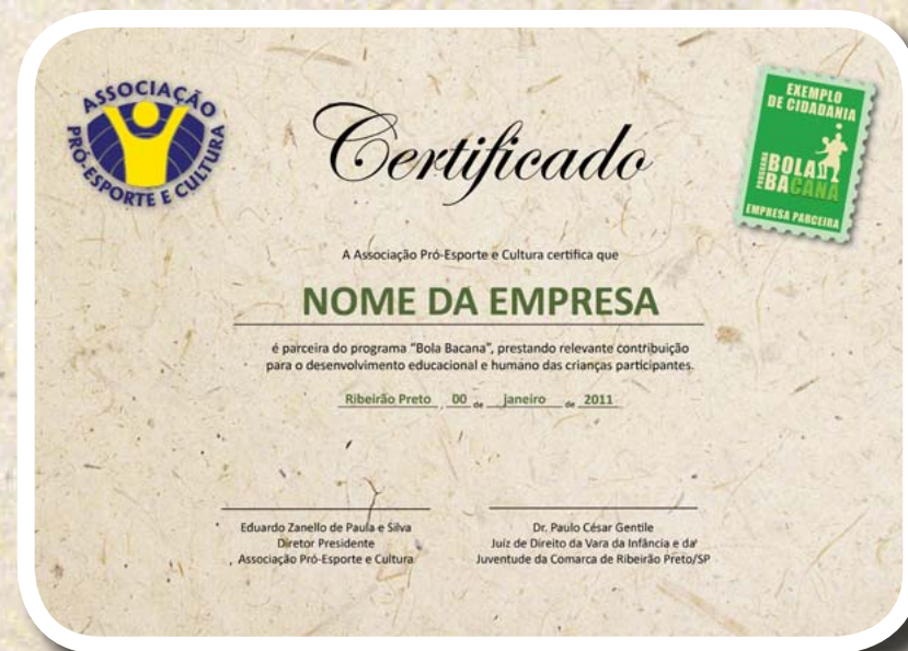
Certificado de “Cidadania Empresarial” e selo “Empresa Parceira, Exemplo de Cidadania”